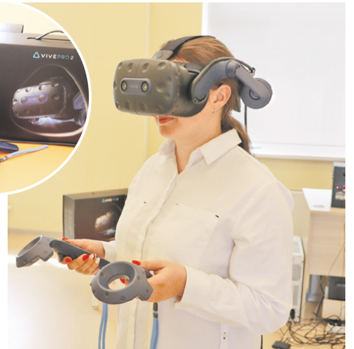
Сотрудник предприятия на себе испытал возможности виртуальной реальности