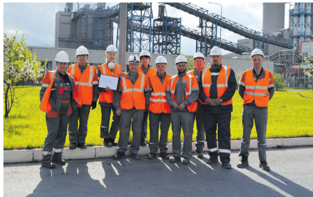
Фото на память на фоне Петербургцемента

Технологи помольного отделения Евроцемента и Смикома встретились, чтобы освежить профессиональные знания.