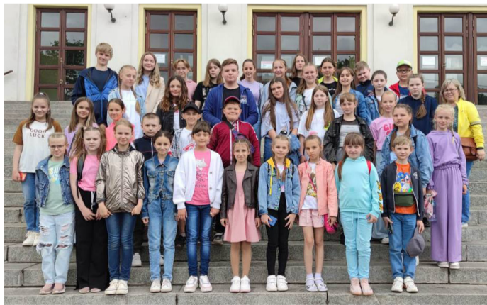
Поездка в цирк прошла на «отлично»