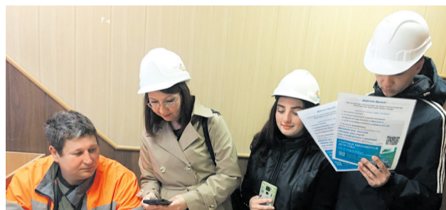
Волонтеры Невьянки собирают подписи для благоустройства набережных

Активисты Невьянского цементника стали волонтерами федерального проекта «Формирование комфортной городской среды».