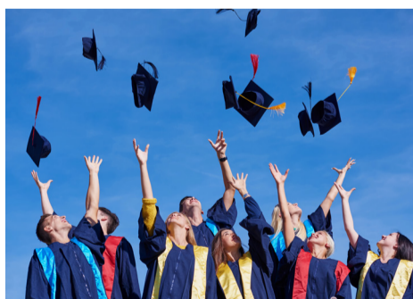
Учебу будет легко совмещать с работой: занятия – дважды в неделю

Прямо сейчас идет отбор кандидатов на участие в партнерской программе МГУ имени М. В. Ломоносова и компании En+ Group. У всех есть возможность получить престижное образование МВА совершенно бесплатно.