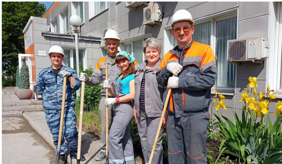
Когда вокруг чисто, и глаз радуется

Более 60 человек и один погрузчик – это сила, кто бы поспорил! Именно в таком составе сотрудники Осколцемента провели экологическую акцию «Нам здесь жить и работать».