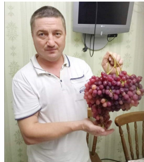
Гордость за урожай

– Ничто так не поднимает настроение, как радостные лица коллег, приходящих на работу, и их слова благодарности за чистоту и красоту! Сейчас мы наводим порядок в зоне отдыха – парке на территории завода. Первый этап – кронирование деревьев – уже сделан, теперь осталось обновить скамейки и дорожки. Совсем скоро в обеденную жару наши цементники смогут передохнуть в прохладной тишине деревьев.