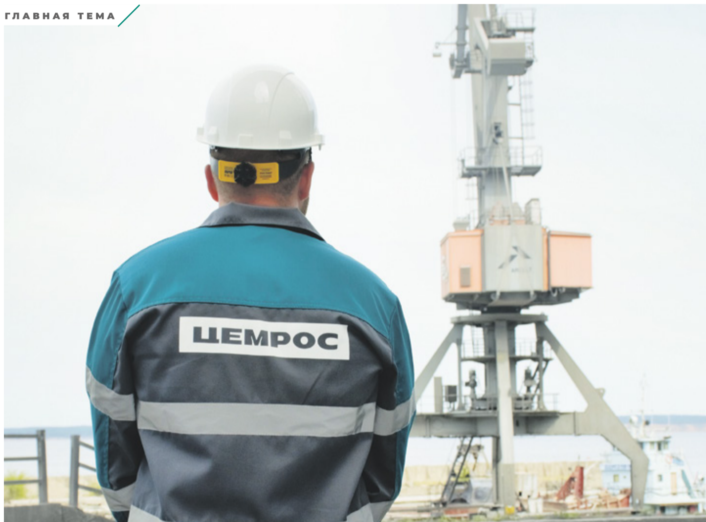
Сенгилеевский цементный завод