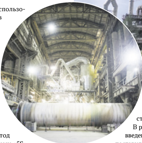
Цементная мельница № 5

Так, специалисты завода предложили провести в цехе помола цемента магистраль. Это позволило снизить расход электроэнергии с 30 до 7,5 кВт, а также сократить количество времени на перемещение емко-