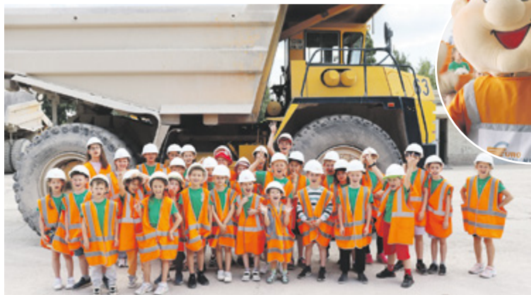
На экскурсии ждет нас замечательный БелАЗ

Почетными гостями Липецкцемента стали юные воспитанники спортивного клуба «Белый тигр». Детям устроили экскурсию по заводу, о которой они сами давно просили.