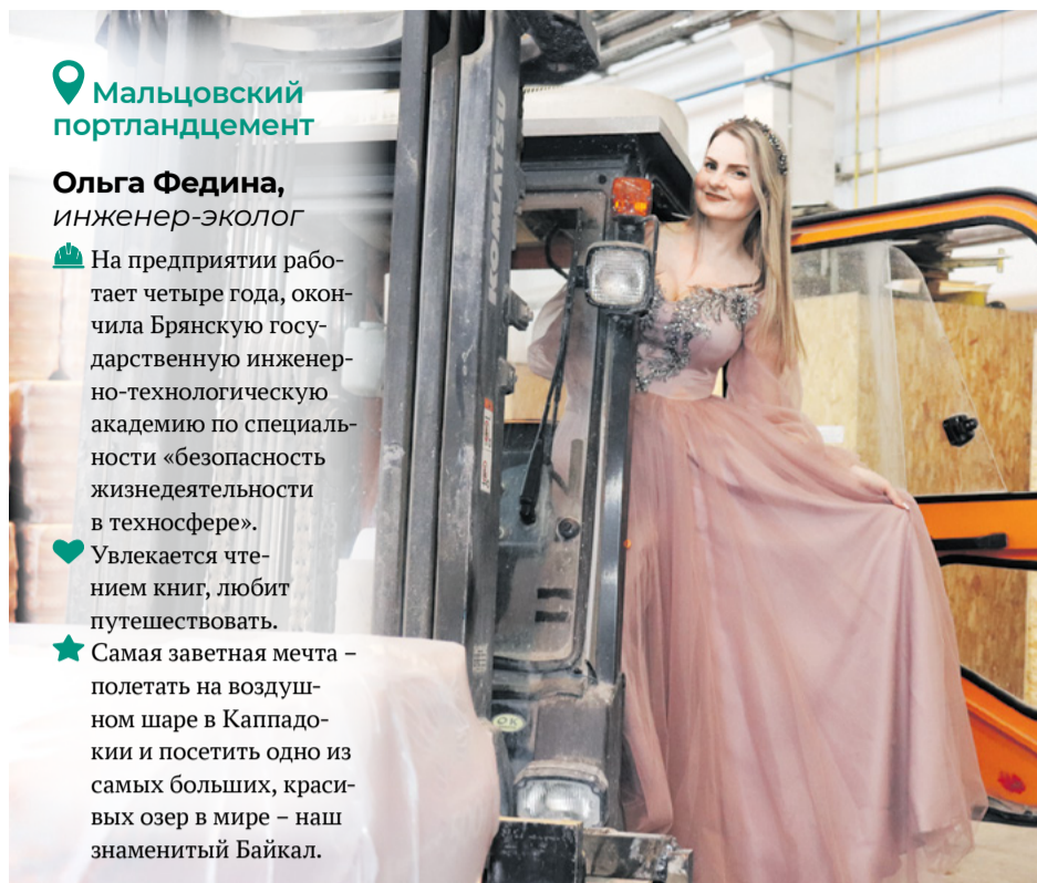
Цех упаковки и отгрузки цемента

★ Самая заветная мечта – полетать на воздушном шаре в Каппадокии и посетить одно из самых больших, красивых озер в мире – наш знаменитый Байкал.