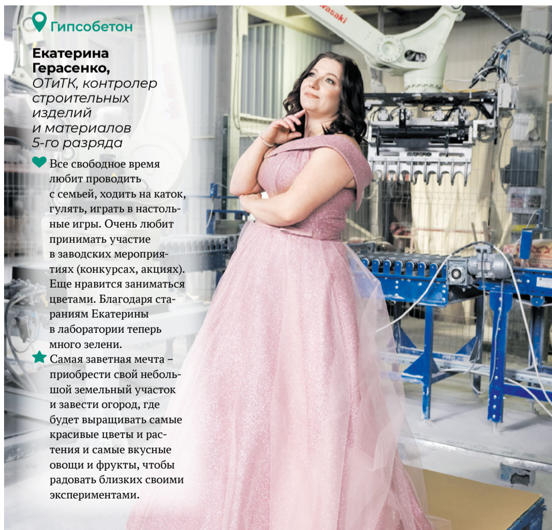
Цех по производству сухих строительных смесей

★ Самая заветная мечта – приобрести свой небольшой земельный участок и завести огород, где будет выращивать самые красивые цветы и растения и самые вкусные овощи и фрукты, чтобы радовать близких своими экспериментами.