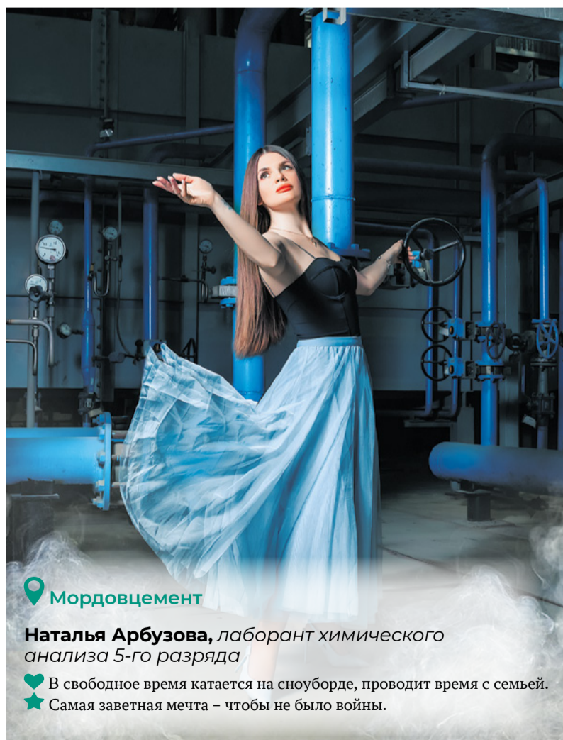
ПГЭС – парогазовая электростанция

★ Самая заветная мечта – чтобы не было войны.