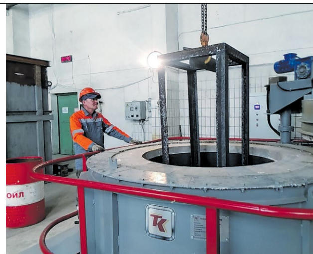
Контроль загрузки детали в печь для закалки

«Новая печь запущена в работу. Сейчас мы занимаемся процессом отладки правильного технологического процесса термозакалки деталей. Работы много. Для восстановления к нам на завод поступают изделия со всего холдинга».