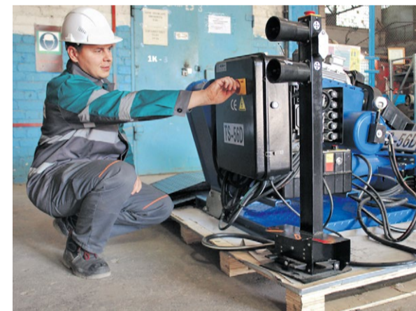
Приемка грузового шиномонтажного стенда перед монтажом

В цехе автотранспорта Осколцемента появилась собственная авторемонтная мастерская. Теперь заводские машины чинят почти так же быстро, как на «Формуле-1».