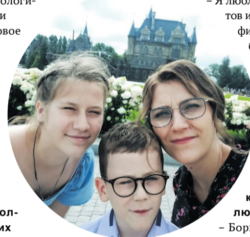
Отдых в замке Гарибальди с семьей