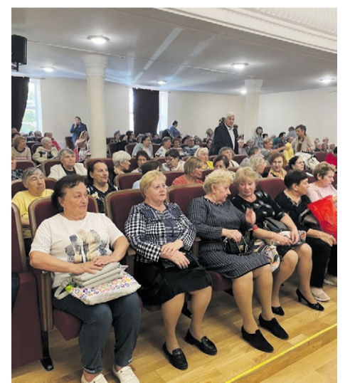
Ветераны Гипсобетона на праздничном концерте

«У нас сложилась добрая традиция каждый год поздравлять своих ветеранов,