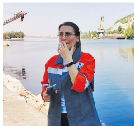
На замерах готовой продукции

– В том смысле, который вкладывает в это слово служба по внедрению Производственной системы, – наверное, нет. Рацпредложений мы не подаем. Но мероприятия по оптимизации и снижению затрат проводим. Реализуем инвестиционные программы для улучшения производственных показателей. В 2022 году мы купили три тяжелых самосвала, погрузчик и отказались от услуг подрядчика при перевозке сырья. Это сэкономило порядка