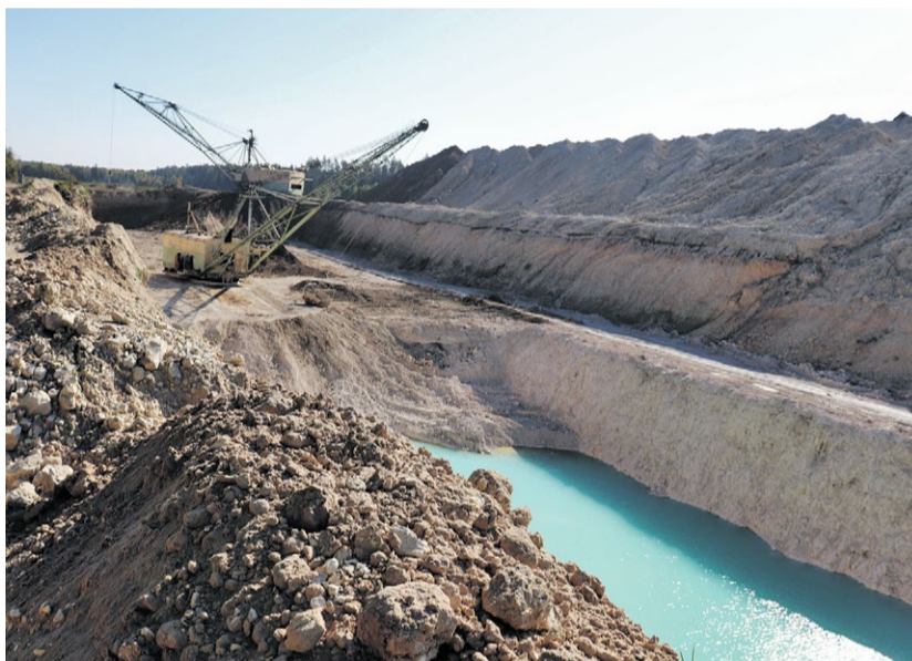
На новом участке Фокинского карьера