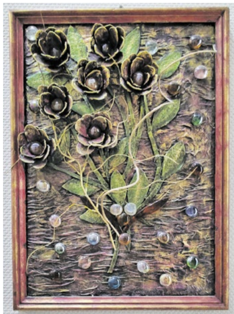
Цветочная композиция, выполненная Светланой Кулешовой из цемента, украшает лабораторию на заводе