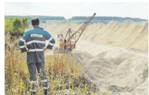
Новая территория для стабильного производственного процесса

На Мордовцементе разработали новый меловой карьер. Уже завершаются работы по сдаче его в эксплуатацию.