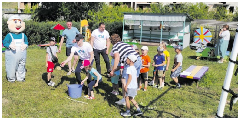
Веселая игра «Самый меткий»

Кстати, в «Малышок» наши активисты приходят не первый раз. В прошлом году предприятие обустроило детскую площадку садика, установив новый навес и игровую форму «Кабриолет».