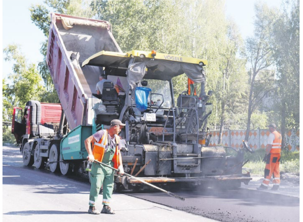
Ремонт дорожного покрытия участка на Березино сделан качественно и в кратчайшие сроки

«В настоящее время участок дороги протяженностью около 3 км уже сдан в эксплуатацию. Параллельно Мальцовский портландцемент оптимизирует логистику движения технологического транспорта для более щадящей эксплуатации нового дорожного полотна. Вскоре начнутся работы по обустройству обочин».