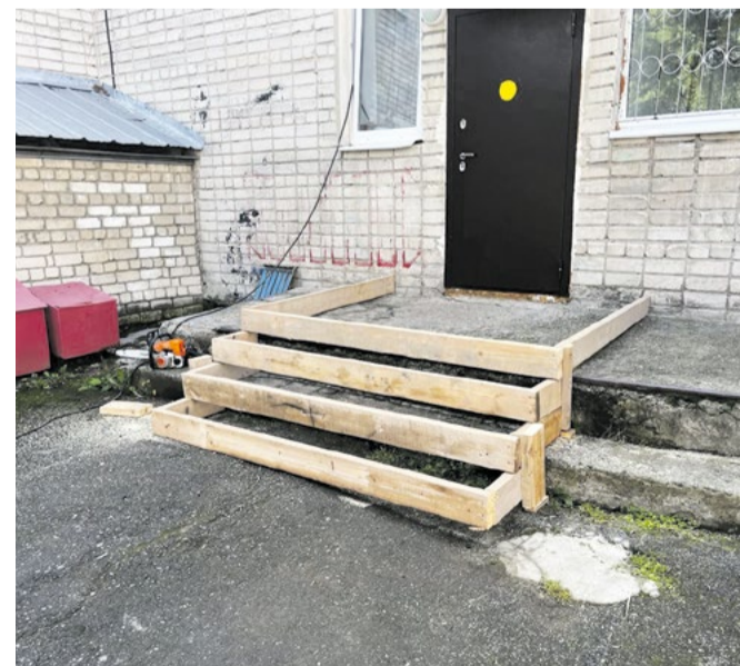
Активисты Совета Молодежи в очередной раз сделали доброе дело своими руками

«Мы продолжим помогать детям, оказавшимся в трудной жизненной ситуации. У деток, у которых нет папы и мамы или которые по тем или иным обстоятельствам проживают не с ними, тоже должно быть счастливое детство, наполненное радостными моментами».