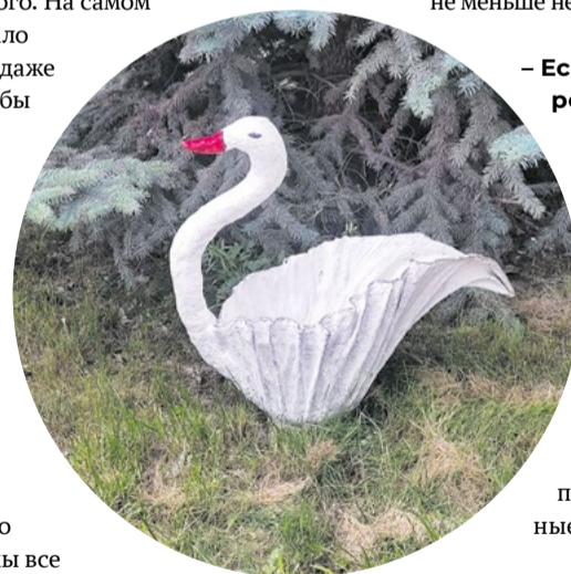
Кашпо в виде лебедя

– Кашпо в виде лебедя. Долго с ним возилась, переделывала. По-моему, получилось очень красиво. Так что цемент нужен не только в строительстве, из него получаются роскошные вещи для декора.