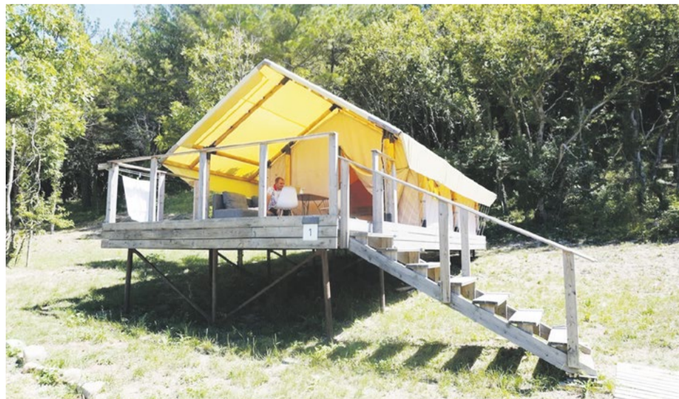
В таких домиках жили и работали будущие мэры