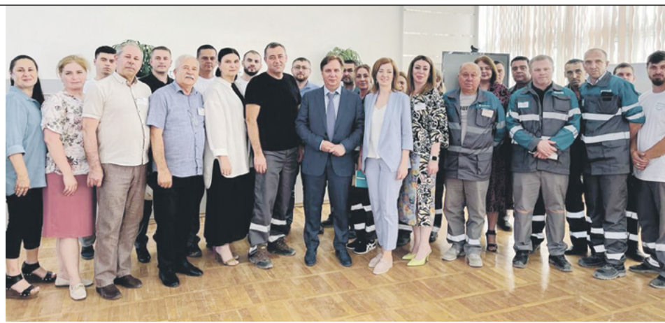
Фото на память с коллективом завода

Как подчеркнул генеральный директор компании, в 2024 году завод должен выйти на максимальную загрузку предприятия и реализовать масштабную и сложную производственную про-