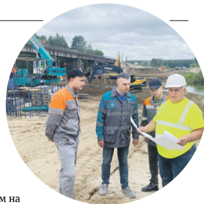
Актив Рабочего Совета знакомится с ходом строительства нового моста

«Мост через Болву, соединяющий части города, очень важен для всех работников нашего предприятия. Большинство из цементников живет в микрорайоне Шибенец, расположенном на правом берегу реки, а завод находится на левом. И мост – единственный путь на работу и обратно домой. Конечно, его судьба, ход строительства – предмет самого пристального внимания цементников».