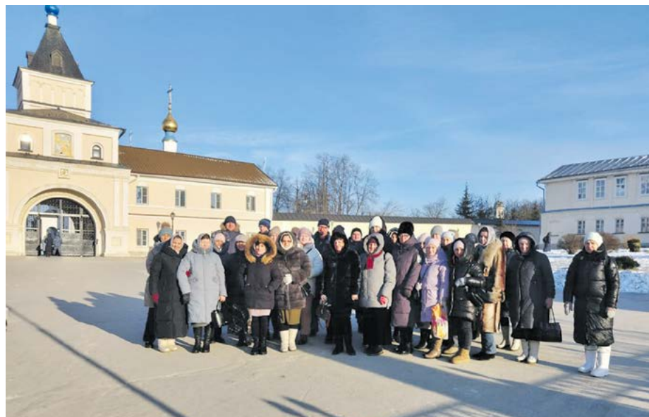
Коллективы предприятий на ознакомительной экскурсии