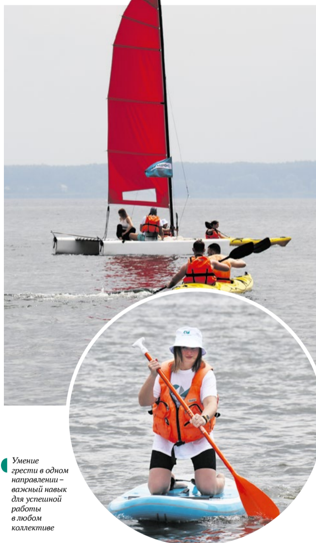
Умение грести в одном направлении – важный навык для успешной работы в любом коллективе