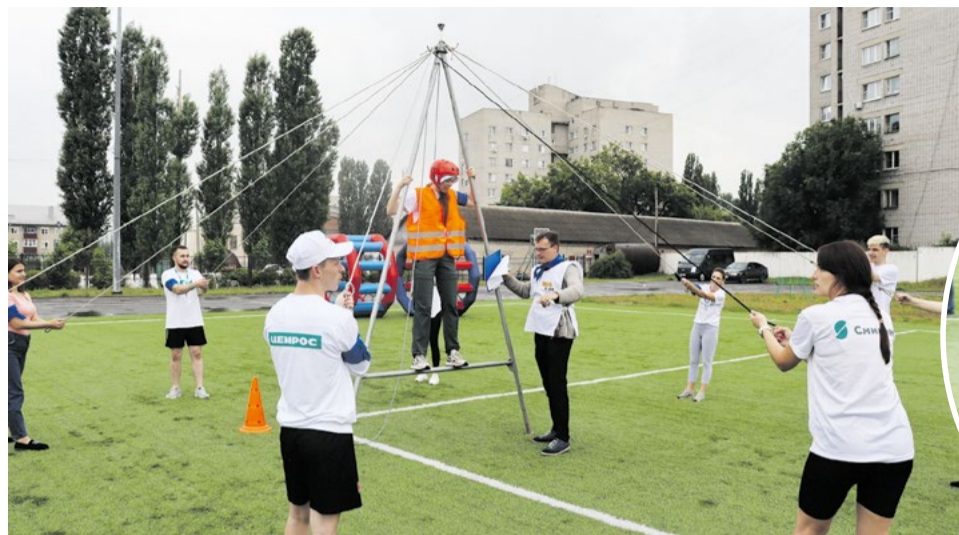
Спортивные конкурсы на природе вызвали восторг у всех участников слета. Ребята повеселились, раскрепостились и сдружились