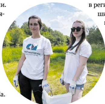
Теперь на берегах рек полный порядок

Мы осознаем свою ответственность перед природой и стараемся делать шаги к улучшению экологической обстановки в регионах. Подобные небольшие дела складываются в одно большое дело сохранения нашей планеты. И каждый может внести свой посильный вклад в будущее.