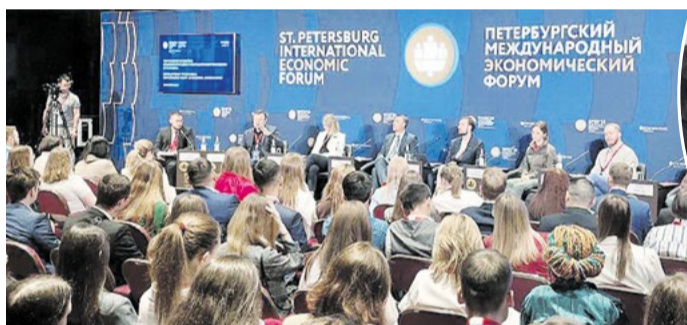
Территория развития: нам есть чему поучиться и есть кому помочь